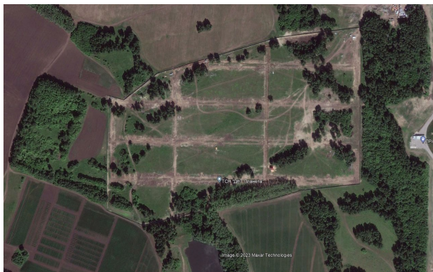
Июнь 2010 года